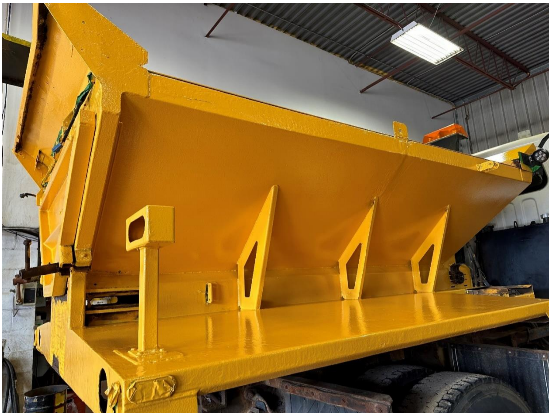
BENNE ÉPANDEUSE AVANT LA RESTAURATION