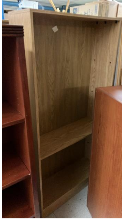
1.00 BIBLIOTHÈQUE DE 36 X 16 X H80 PO BRUNE CONDITION INCONNUE, SANS GARANTIE