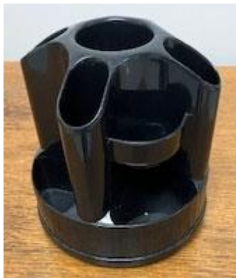
19.00 PORTE-COPIES AVEC BRAS DE MÉTAL GRIS-BEIGE CONDITION INCONNUE, SANS GARANTIE