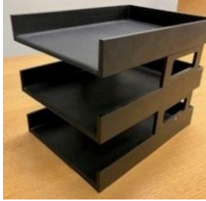
30.00 ORGANISATEURS DE BUREAU ROTATIFS EN PLASTIQUE NOIRS CONDITION INCONNUE, SANS GARANTIE