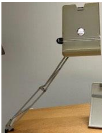
9.00 PORTE-COPIES DE TYPE CHEVALET EN MÉTAL GRIS-BEIGE CONDITION INCONNUE, SANS GARANTIE