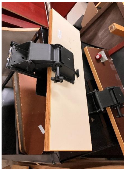
3.00 SUPPORT À CLAVIERS EN ANGLE DE 21 PO GRIS CONDITION INCONNUE, SANS GARANTIE