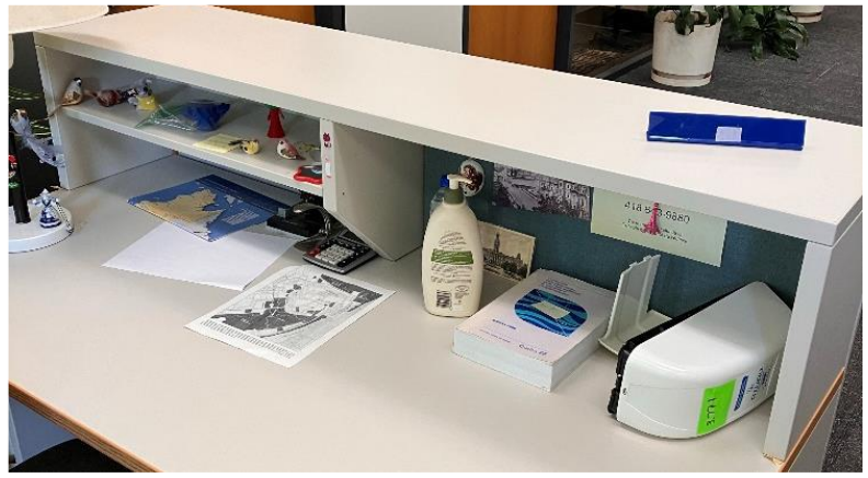
2.00 TABLES À DACTYLOGRAPHIER DE 20 X 38 PO GRISES CONDITION INCONNUE, SANS GARANTIE