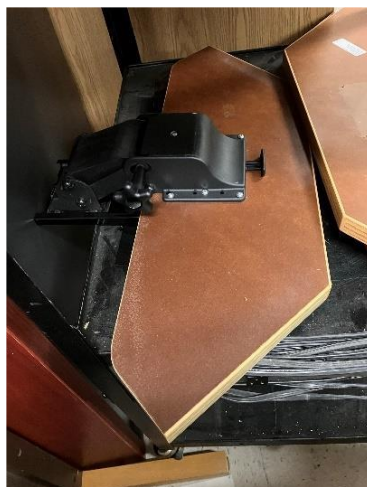
7.00 SUPPORT À CLAVIERS EN ANGLE DE 17 PO GRIS CONDITION INCONNUE, SANS GARANTIE