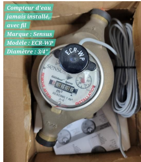
Compteur d'eau jamais installé, avec fil Marque : Sensus Modèle : ECR-WP Diamètre : 3/4"