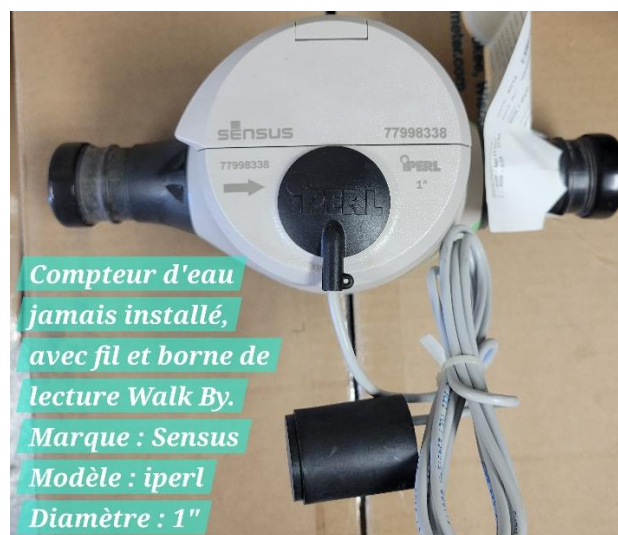
Compteur d'eau jamais installé, avec fil et borne de lecture Walk By. Marque : Sensus Modèle : iperl Diamètre : 1"