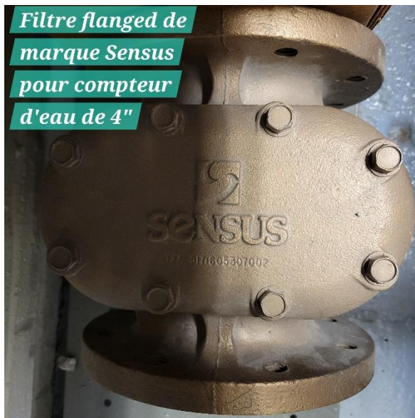
Filtere flanged de marque Sensus pour compteur d'eau de 4"