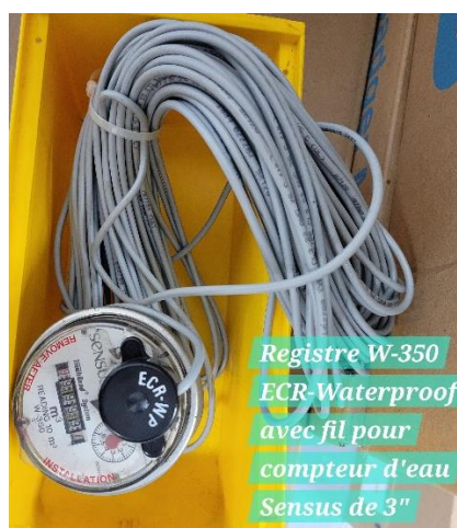
Registre W-350 ECR-Waterproof avec fil pour compteur d'eau Sensus de 3"