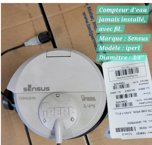
Compteur d'eau jamais installé, avec fil. Marque : Sensus Modèle : iperl Diamètre : 3/4"