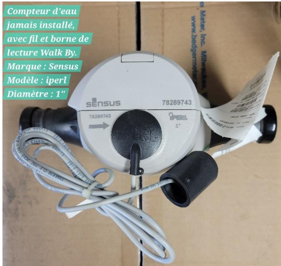
Compteur d'eau jamais installé, avec fil et borne de lecture Walk By. Marque : Sensus Modèle : iperl Diamètre : 1"