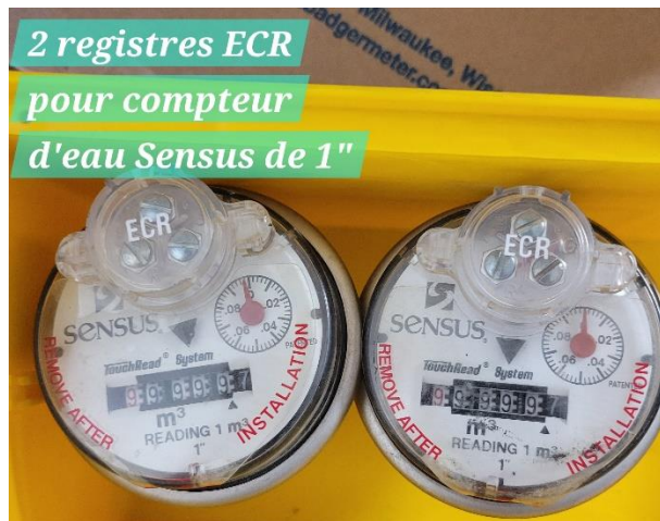
2 registres ECR pour compteur d'eau Sensus de 1"