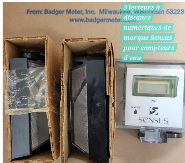
3 lecteurs à distance numériques de marque Sensus pour compteurs d'eau