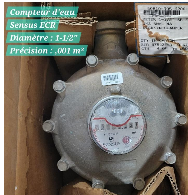
Compteur d'eau Sensus ECR Diamètre : 1-1/2" Précision : ,001 m 3