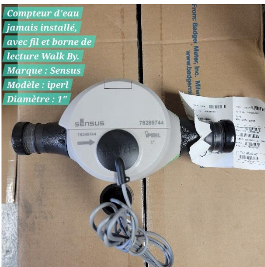
Compteur d'eau jamais installé, avec fil et borne de lecture Walk By. Marque : Sensus Modèle : iperl Diamètre : 1"