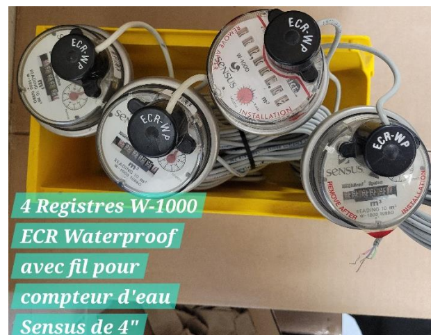
4 Registres W-1000 ECR Waterproof avec fil pour compteur d'eau Sensus de 4"