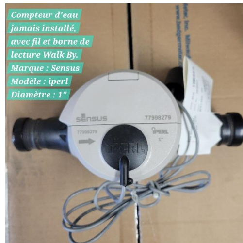
Compteur d'eau jamais installé, avec fil et borne de lecture Walk By. Marque : Sensus Modèle : iperl Diamètre : 1"