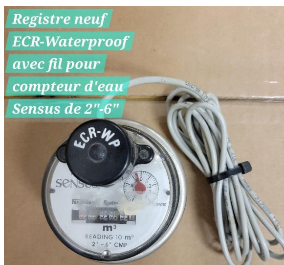
Registre neuf ECR-Waterproof avec fil pour compteur d'eau Sensus de 2"-6"