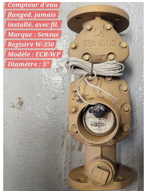
Compteur d'eau flanged, jamais installé, avec fil. Marque : Sensus Registre W-350 Modèle : ECR-WP Diamètre : 3"