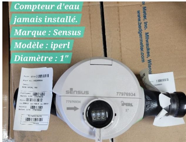
Compteur d'eau jamais installé. Marque : Sensus Modèle : iperl Diamètre : 1"