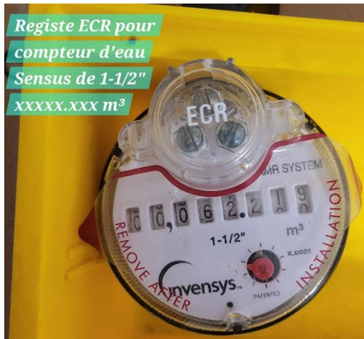
Registre ECR pour compteur d'eau Sensus de 1-1/2" XXXXX.XXX m 3