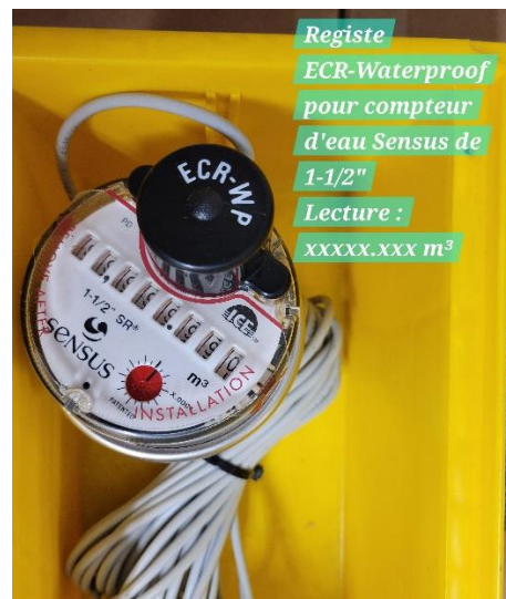
Registe ECR-Waterproof pour compteur d'eau Sensus de 1-1/2" Lecture : xxxxx.xxx m 3