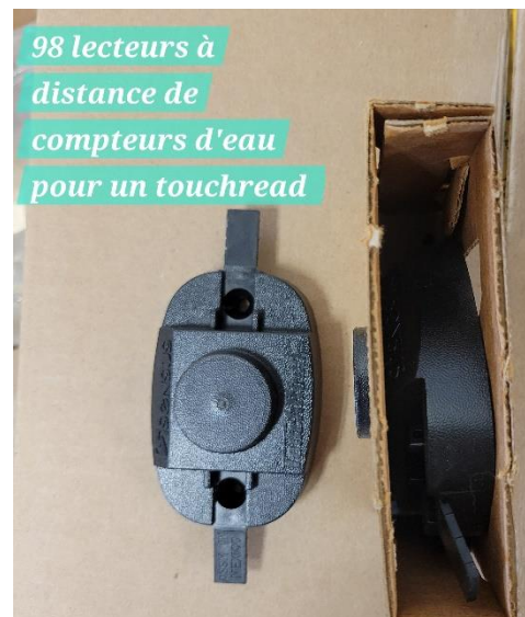
98 lecteurs à distance de compteurs d'eau pour un touchread