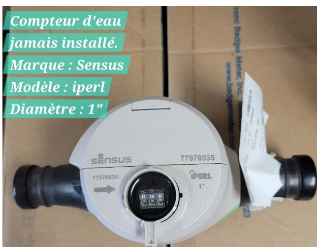
Compteur d'eau jamais installé. Marque : Sensus Modèle : iperl Diamètre : 1"