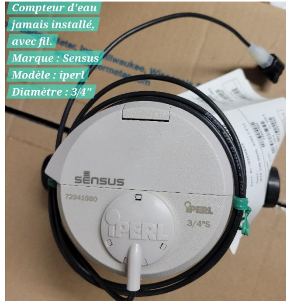
Compteur d'eau jamais installé, avec fil. Marque : Sensus Modèle : iperl Diamètre : 3/4"